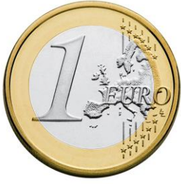
1 Euro Münze

Hier siehst du Ausschnitte von verschiedenen Gegenständen. Erkennst du, was es ist? Schreibe die Namen darunter.