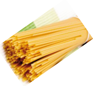
Spaghetti / Spagetti